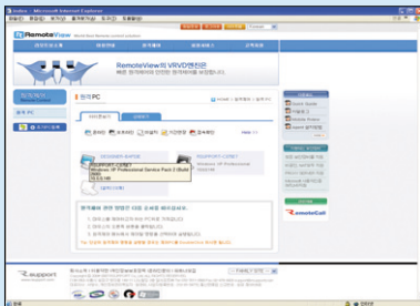
1. www.rview.net에서 로그인