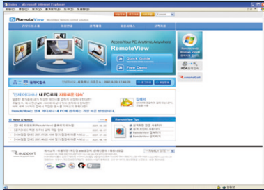
1. www.rview.net에서 회원가입