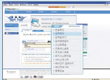
2. 제어할 PC를 선택