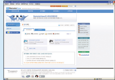
3. 등록된 PC 리스트 확인